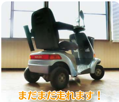
まだまだ走れます!