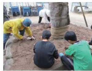
チューリップ植え