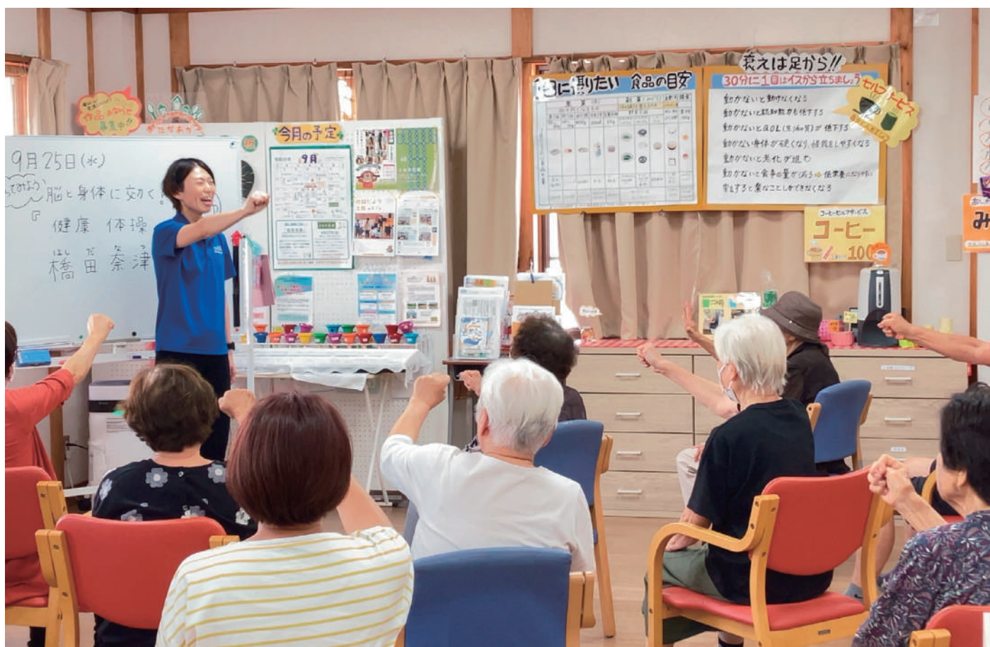
【あったかふれあいセンター高岡】誰もが集える居場所づくりを目指して元気に開所中！