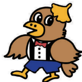
(土佐市社協公式マスコット)