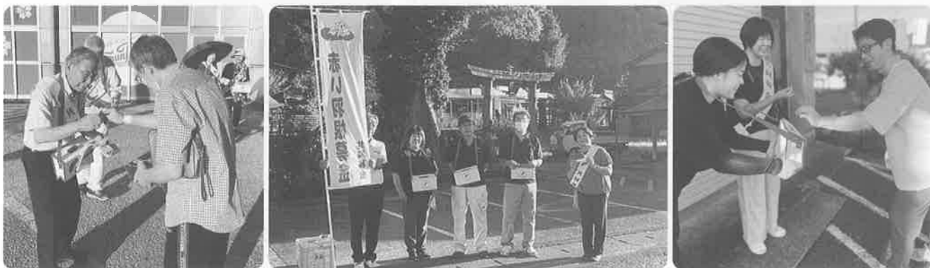
事務局：高知県共同募金会佐川町共同募金委員会（社協内）