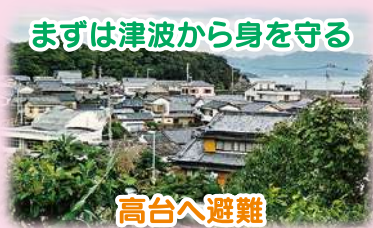
まずは津波から身を守る

「津波防災の日」にあわせて、住民としおさい合同で行いました。防災の講話や、実際に簡易ベッドやパーティションを住民が設置しました。