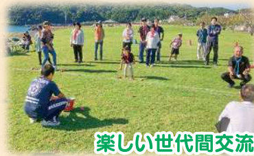
楽しい世代間交流、でも競技は真剣勝負!