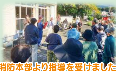
消防本部より指導を受けました!

当日は、訓練用の防災無線を合図に一次避難。その後、区長場に集合して防災炊き出し訓練を行いました。