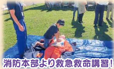
消防本部より救急救命講習!

今年で8回目になるニコニコまつりは、地区、婦人会、消防団などが中心となり、世代間で楽しめる内容で賑やかに開催されています。