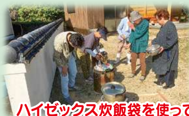
ハイゼックス炊飯袋を使って炊飯。その後試食を行いました。