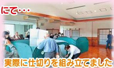
実際に仕切りを組み立てました