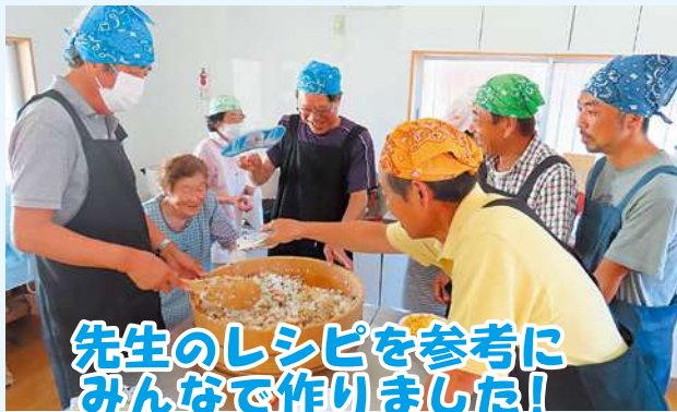
先生のレシピを参考に みんなで作りました!

次回も!!という声も聞かれたので、この機会を通じて久百々の伝統がつむがれていくよう、引き続き取り組んでいけたらいいですね!!