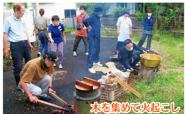
木を集めて火起こし

社会福祉法人が情報共有の場を設け、土佐清水市において連携した具体的な取り組みを行うことを目的に連絡会を開催しております。土佐清水市の5法人(百日紅の家・あんきな家・太陽の家・さんごはうす共同作業所・社会福祉協議会)で連絡会を行う中で、いつ起こるか分からない災害に備え福祉避難所に関する訓練の必要性や災害対応の取組について意見が出されました。令和6年6月23日に、百日紅の家の炊き出し訓練に各法人の職員が参加し、訓練終了後には現状や課題を共有、災害時の事前対策に役立てることや法人同士の連携につながりました。今後も公益的な取り組みに向けて連携を行っていきます。