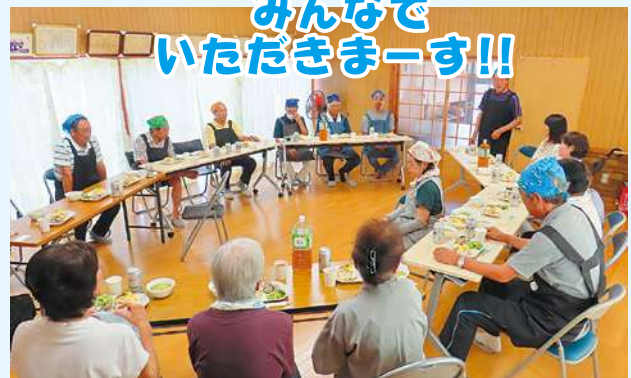
みんなで いただきまーす!!