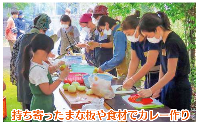
持ち寄ったまな板や食材でカレー作り