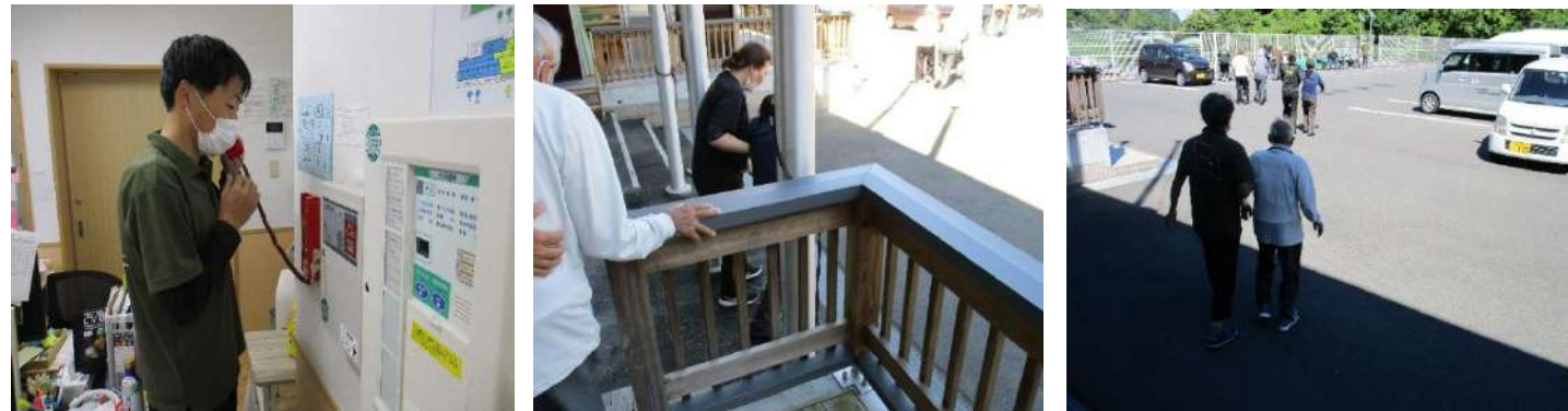
火災通報装置にて通報