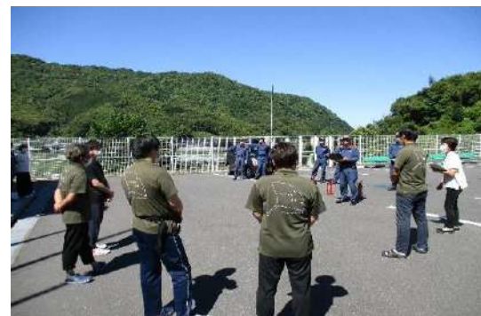
中土佐分署より総評