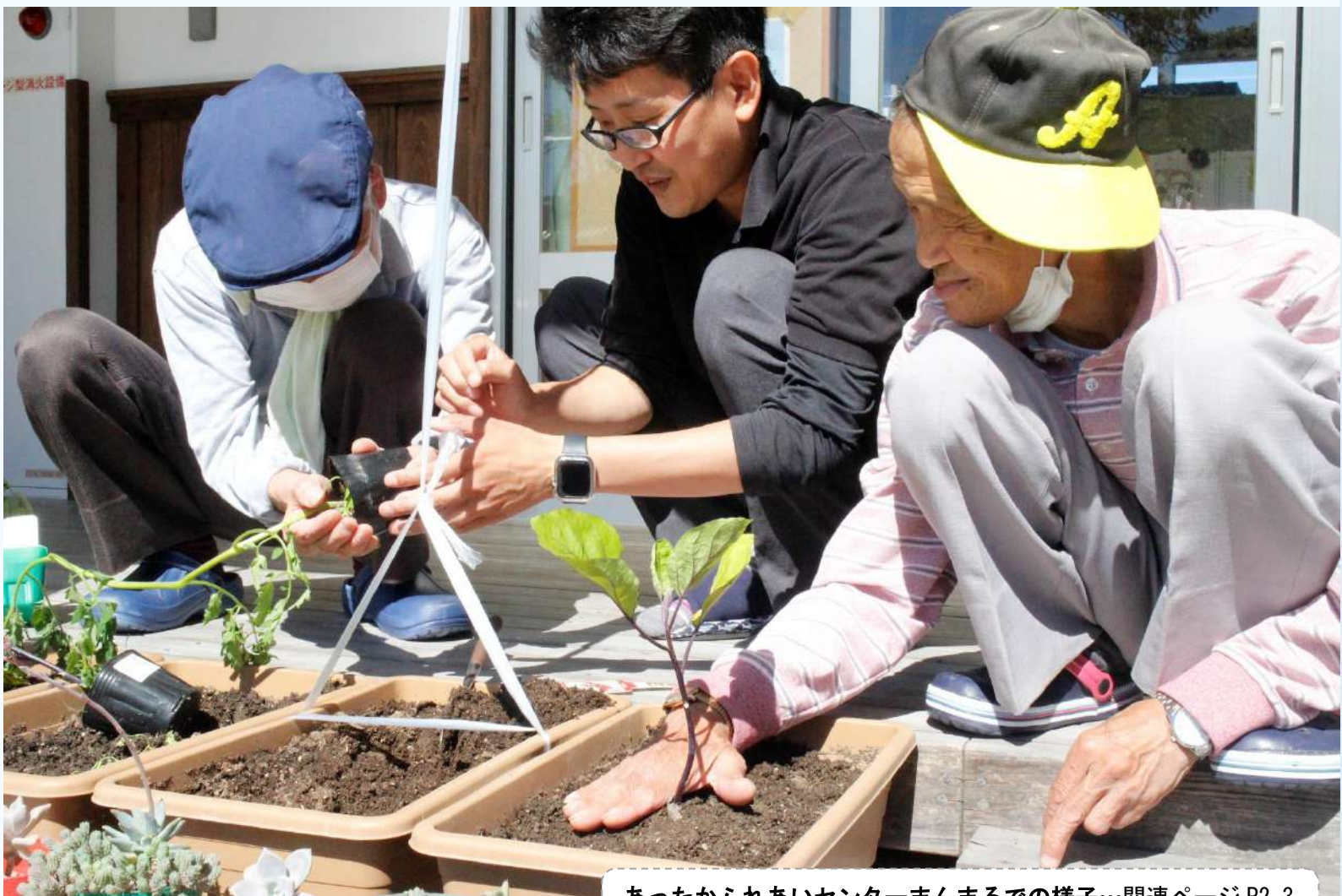
あったかふれあいセンターまんまるでの様子…関連ページ P2-3 利用者さんと職員と一緒に野菜を育てています。