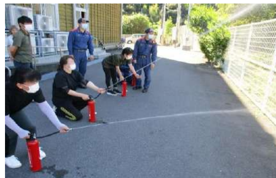
消火器を使った訓練

つどい処では、「自分の命は自分で守る、大災害時に備えよう」と定期的な避難訓練や防災の学びを行っています。本年度も、つどい処の防災活動記録を掲載していきます。