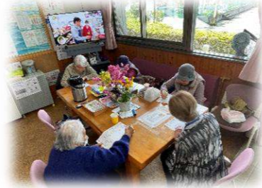
『カード作成の様子』