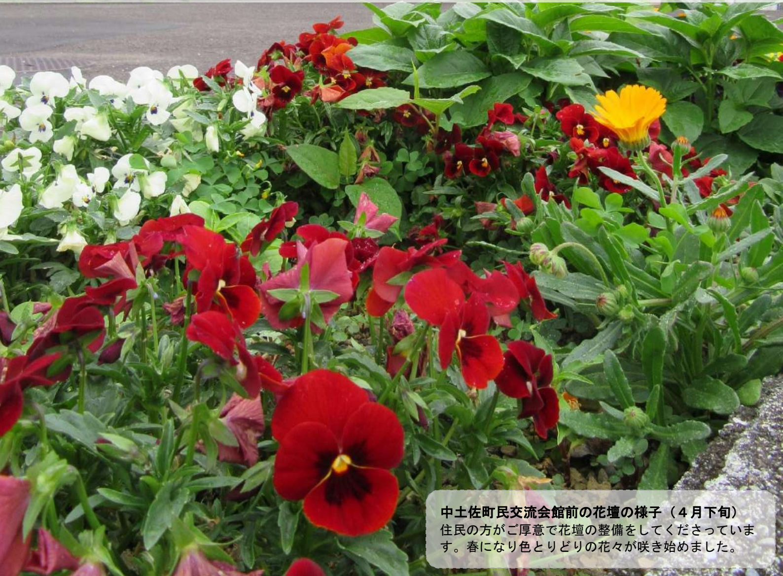
中土佐町民交流会館前の花壇の様子（4月下旬） 住民の方がご厚意で花壇の整備をしてくださっています。 春になり色とりどりの花々が咲き始めました。