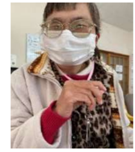
災害時にSOSの発信をするため、笛を身に付けています