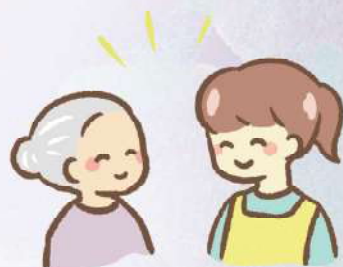
見守り・話し相手