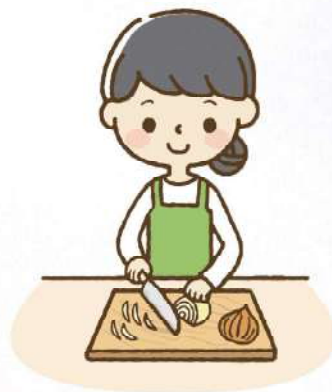
調理ボランティア