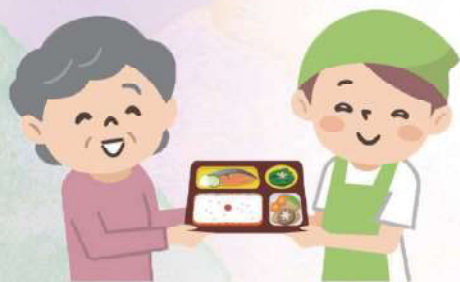
配食ボランティア